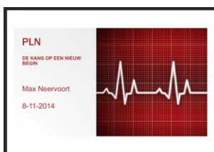
Presentatie Max Neervoort, PLN drager PLN, de kans op een nieuw begin