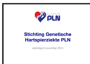
Presentatie Pieter Glijnis Stichting Genetische Hartspierziekte PLN